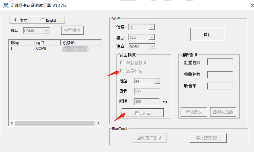
图 4-2-2 无温度补偿（界面增益生效）