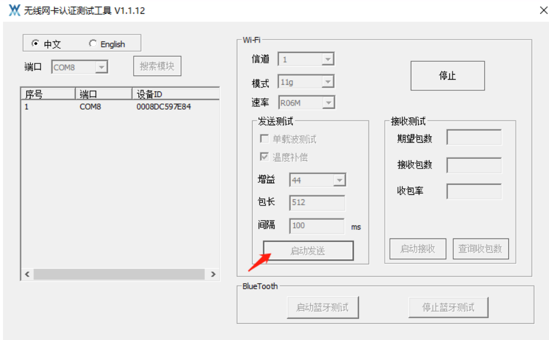
图 4-2-1 有温度补偿（界面增益不生效）